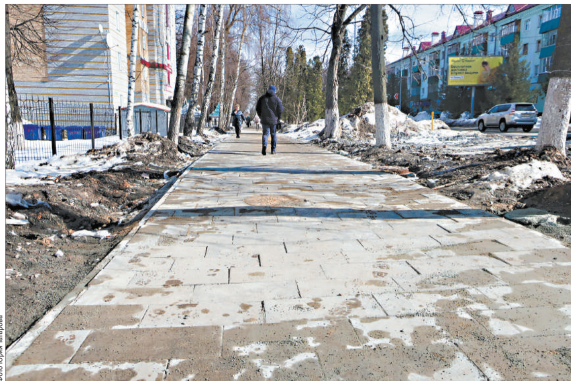
Одной из распространённых ошибок при укладке плитки является неправильная подготовка основания

Потребитель вправе отказаться от исполнения договора о выполнении работы (оказании услуги) и потребовать полного возмещения убытков, если в установленный указанным договором срок недостатки выполненной работы (оказанной услуги) не устранены исполнителем. Потребитель также вправе отказаться от исполнения договора о выполненной работе (оказании услуги), если им обнаружены существенные недостатки выполненной работы (оказанной услуги) или иные