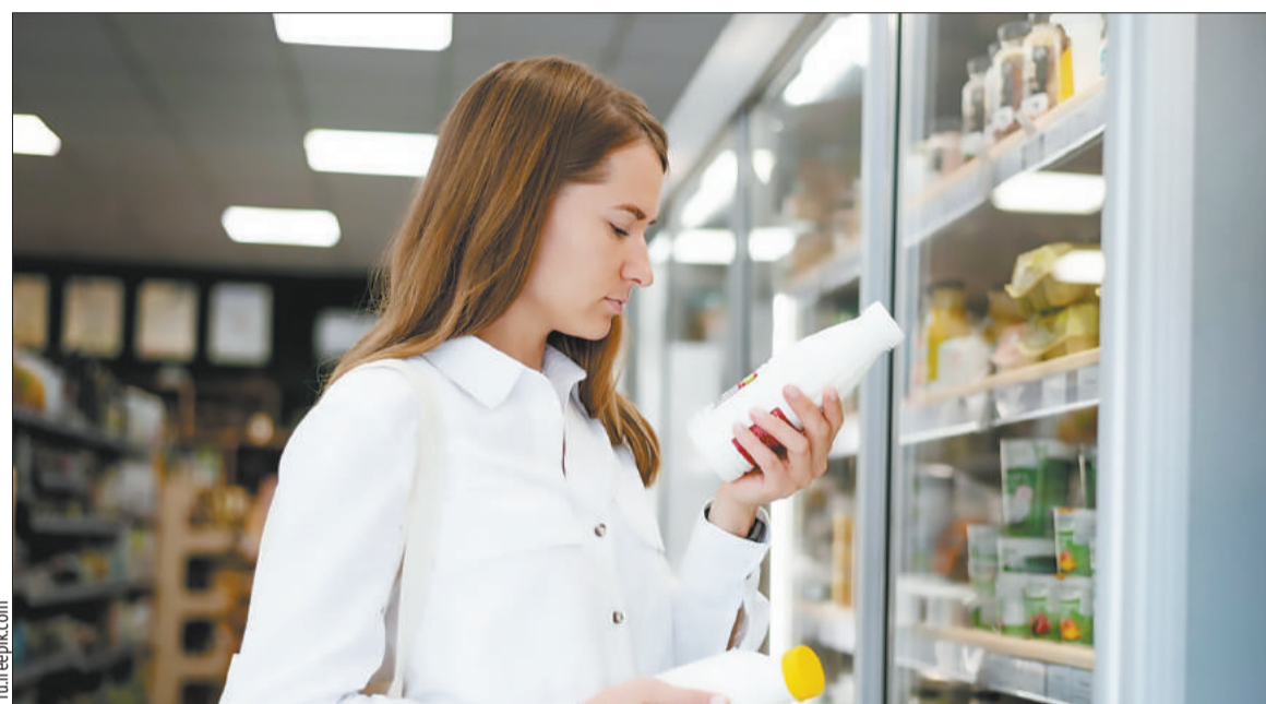
К повышению цен люди относятся весьма болезненно, а вот к изменению веса в упаковке — относительно спокойно

Как продавцы и производители обманывают покупателей