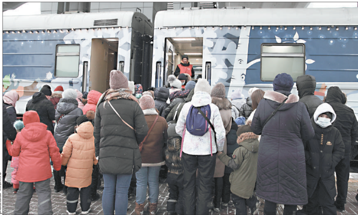
Новыми правилами установлен запрет на высадку из поездов несовершеннолетних граждан, не достигших 16-летнего возраста

Согласно новым правилам, медицинская организация обязана сообщать потребителю сведения о форме и способах направления обращений или жалоб в госорганы и организации, а также по обращению потребителя выдать документы, подтверждающие фактические расходы потребителя за оказанные медуслуги и приобретенные лекарственные препараты для медицинского применения. Дистанционная оплата медуслуг через счета третьих лиц не освобождает медорганизацию от обязательств возврата средств потребителю, как при отказе от исполнения договора, так и при оказании медицинских услуг.