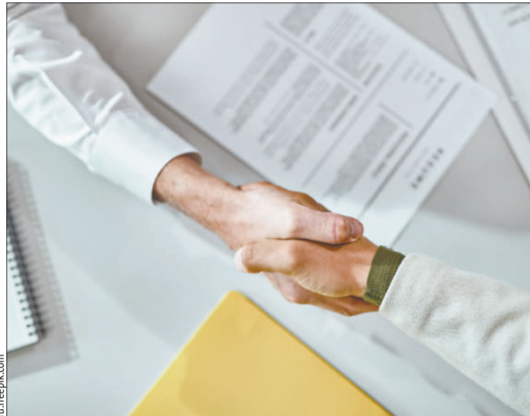
Публичная оферта должна содержать все условия договора розничной купли-продажи

условия договора розничной купли-продажи. Существенными условиями для договоров купли-продажи являются: