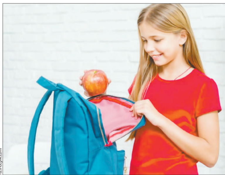
Удобно, когда пространство внутри ранца разделено на несколько отделений; основные отделения должны закрываться на застежку-молнию с легким ходом

присутствовать пластиковое или прорезиненное дно;